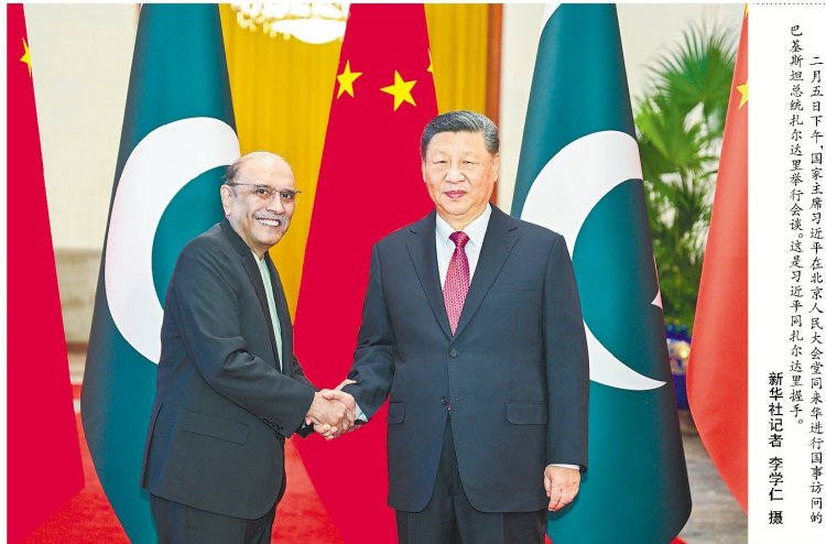
二月五日下午，国家主席习近平在北京人民大会堂同来华进行国事访问的巴基斯坦总统扎尔达里举行会谈...

习近平强调，双方要继续开创新局面，以高质量共建“一带一路”为主线，推动互利合作不断深入。中方愿持续扩大经贸投资合作，进口更多中国成功产品。