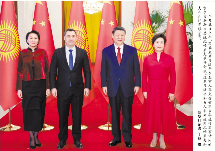
二月五日上午，国家主席习近平在北京人民大会堂同吉尔吉斯斯坦总统扎帕罗夫举行会谈...

新华社北京2月5日电 2月5日上午，国家主席习近平在北京人民大会堂同来华进行国事访问的吉尔吉斯斯坦总统扎帕罗夫举行会谈。