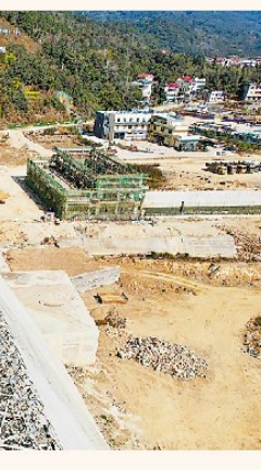
莆田西音水库大坝填筑完工

主要进出口产品表现亮眼,结构持续优化。2024年,龙岩机电产品出口65.9亿元,增长16.2%,其中,工程机械增长12.2%,锂离子电池、电动汽车等“新三样”产品劲增1.5倍。此外,木制品、基本有机化学品等特色产品出口增速分别为12.5%、89.8%。