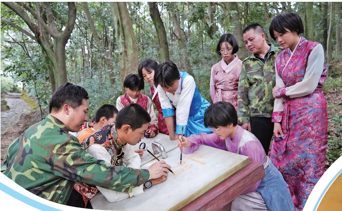
列东中学的学生在“汉藏林”纪念碑上描金。