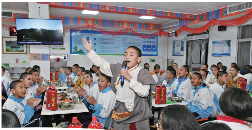
在2025年藏历新年上,藏娃在放声歌唱。