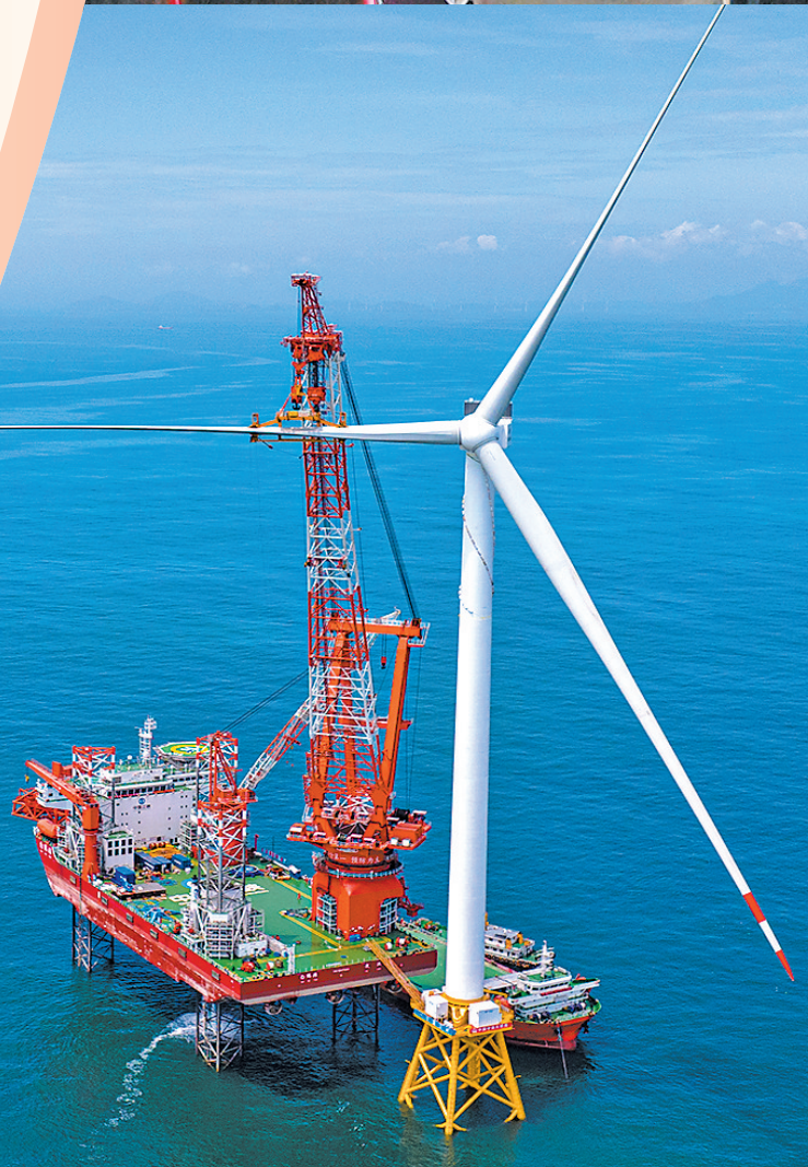
全球首台16兆瓦超大容量海上风电机组在平潭外海安装。