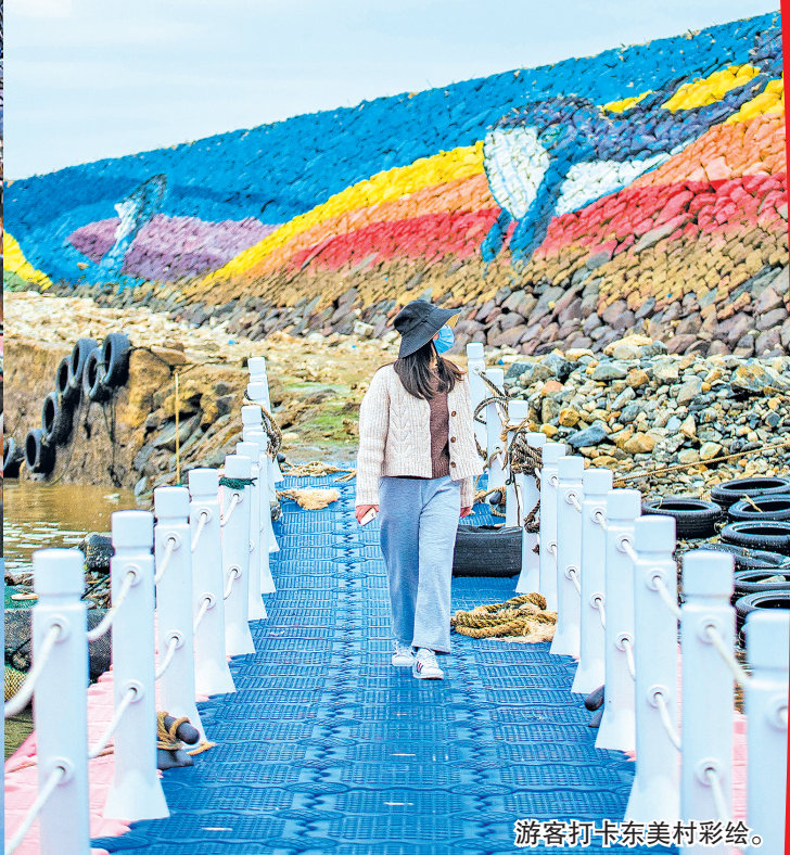
游客打卡东美村彩绘。