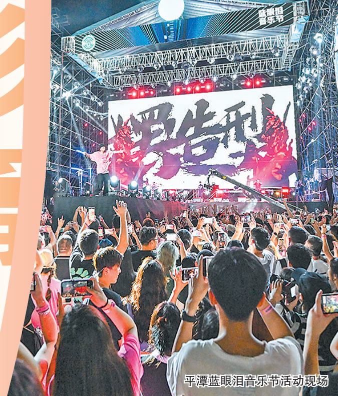
平潭蓝眼泪音乐节活动现场。