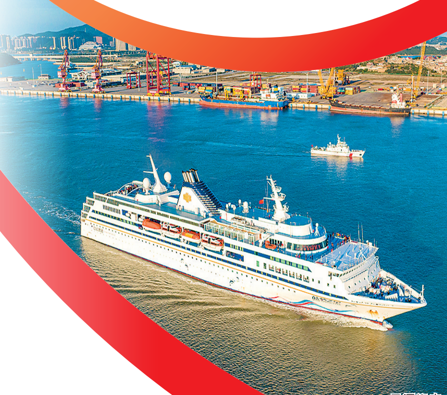
平潭海峡公铁大桥国际邮轮“蓝梦之星”。

建设“一岛两窗三区”,第一个十年只是序章。奔赴下一个十年,我们坚信,在习近平新时代中国特色社会主义思想指引下,“平潭号”巨轮必将乘风破浪斩浪、扬帆远航,在新征程上开创美好明天、书写壮丽新篇章!