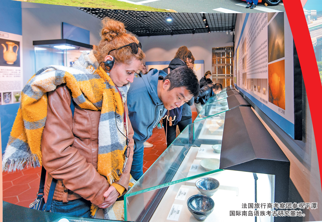
法国旅行商等参团参观平潭国际南岛语族考古研究基地。