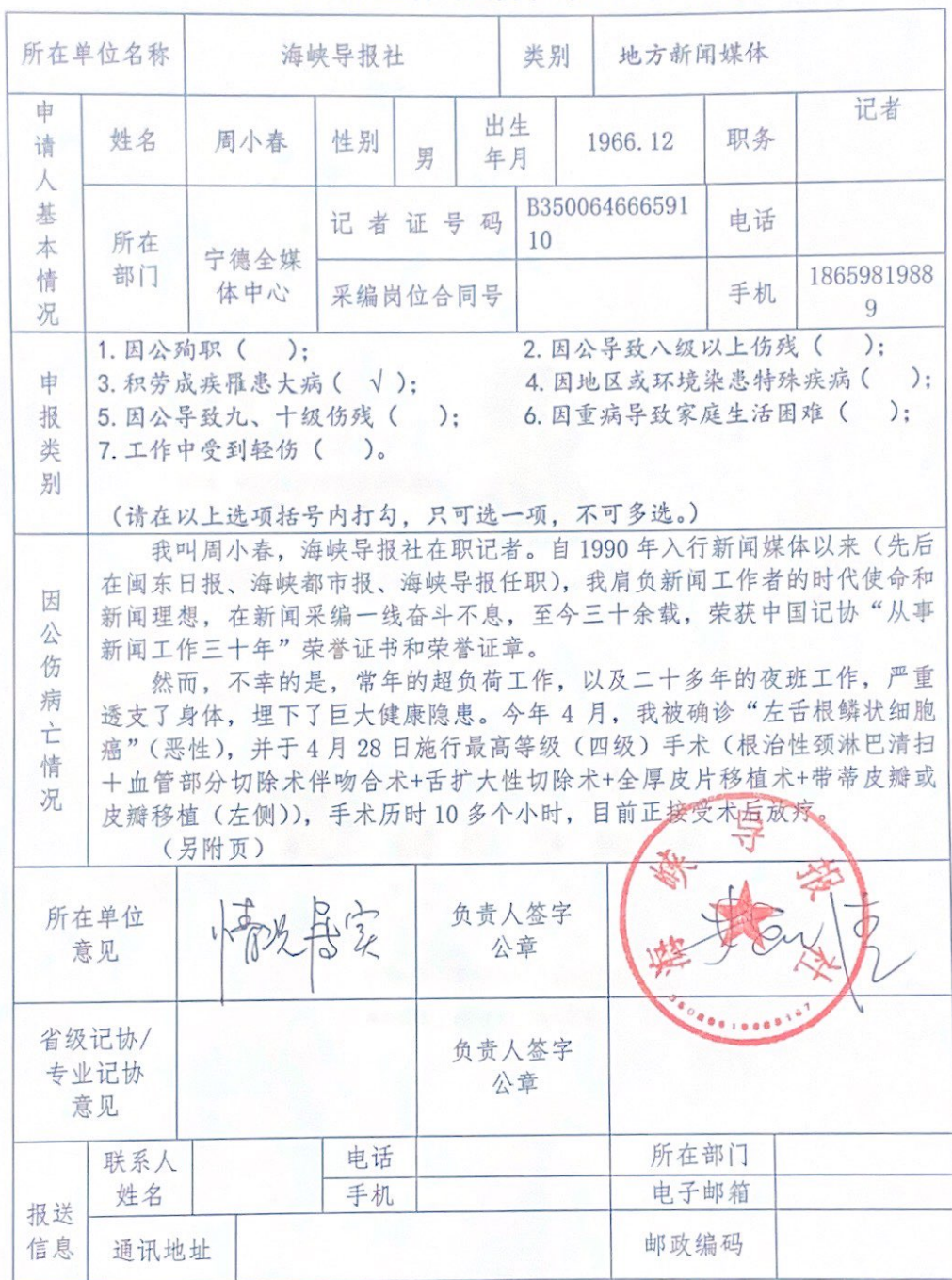
中国新闻工作者援助项目申请表